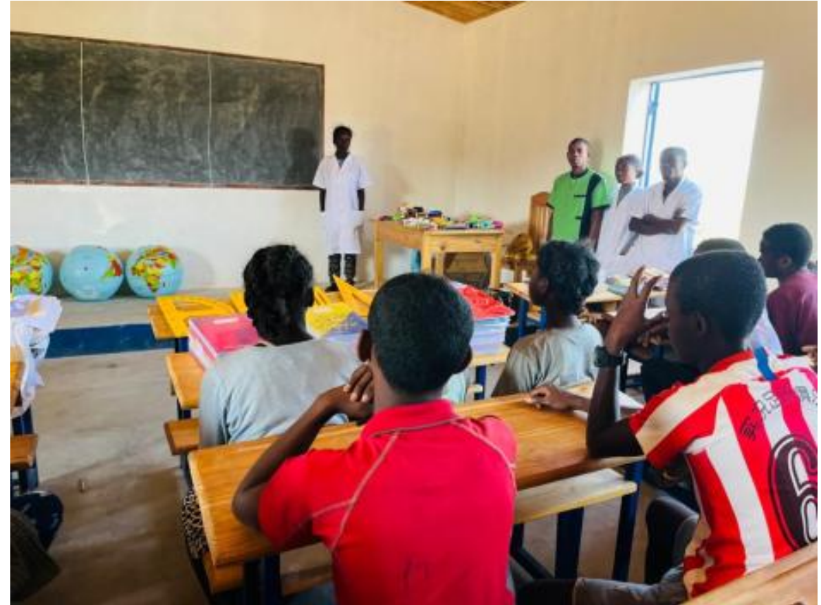
Table, armoire, chaise, bancs tables