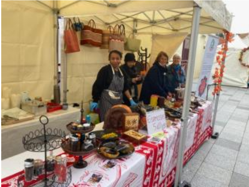
Saveurs d'automne le 12 octobre