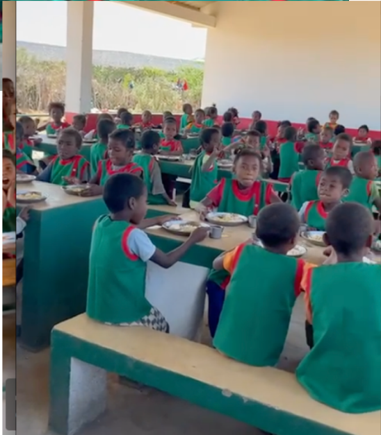
Dotation en blouses