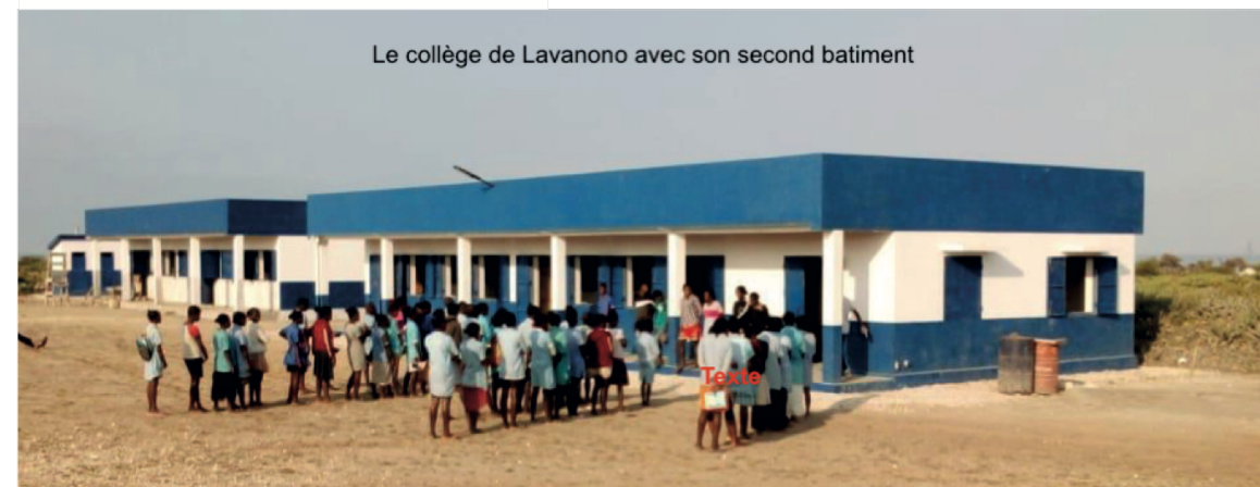
Le collège de Lavanono avec son second bâtiment

Effectifs 2024 : 75 élèves inscrits de la 6e à la 4e (44 en 2023)