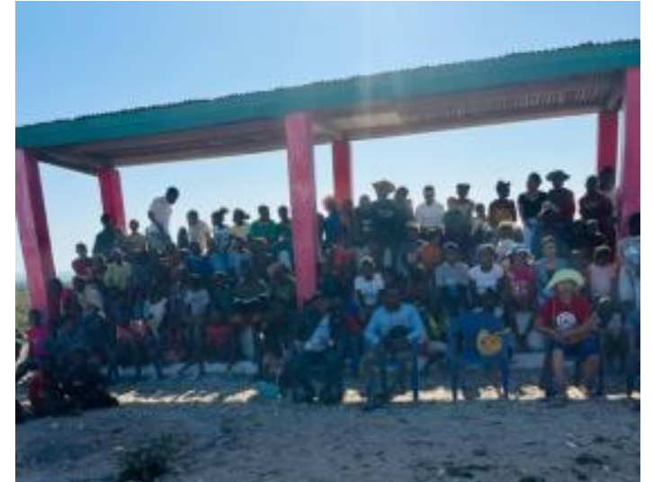
Réunion du CA le 19 octobre