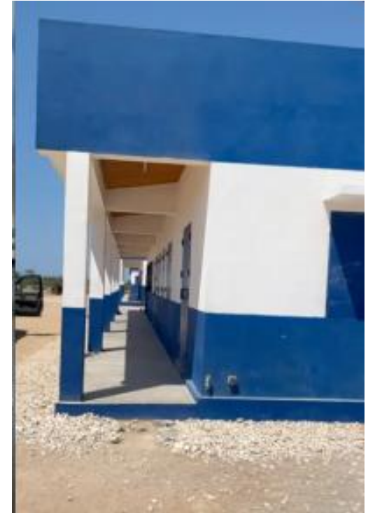
Le collège de Lavanono avec son second bâtiment

75 élèves inscrits à la rentrée 2024 de la 6 ème à la 4 ème (44 élèves en 2023)