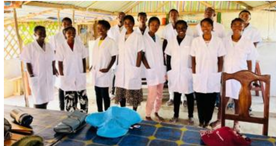
Blouses pour les enseignants