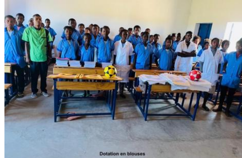
Dotation en blouses